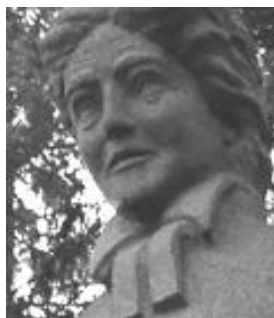
Christfrid Ganander (1741-1790)

Lessicografo e mitografo finlandese. Fu tra i primi folkloristi a registrare proverbi, indovinelli, credenze e canti popolari finnici. Tale materiale gli servì per la compilazione del Nytt finsk lexicon , un vasto dizionario della lingua finnica, destinato a rimanere però inedito, e la Mythologia Fennica , che l'autore pubblicò a proprie spese nel 1789.